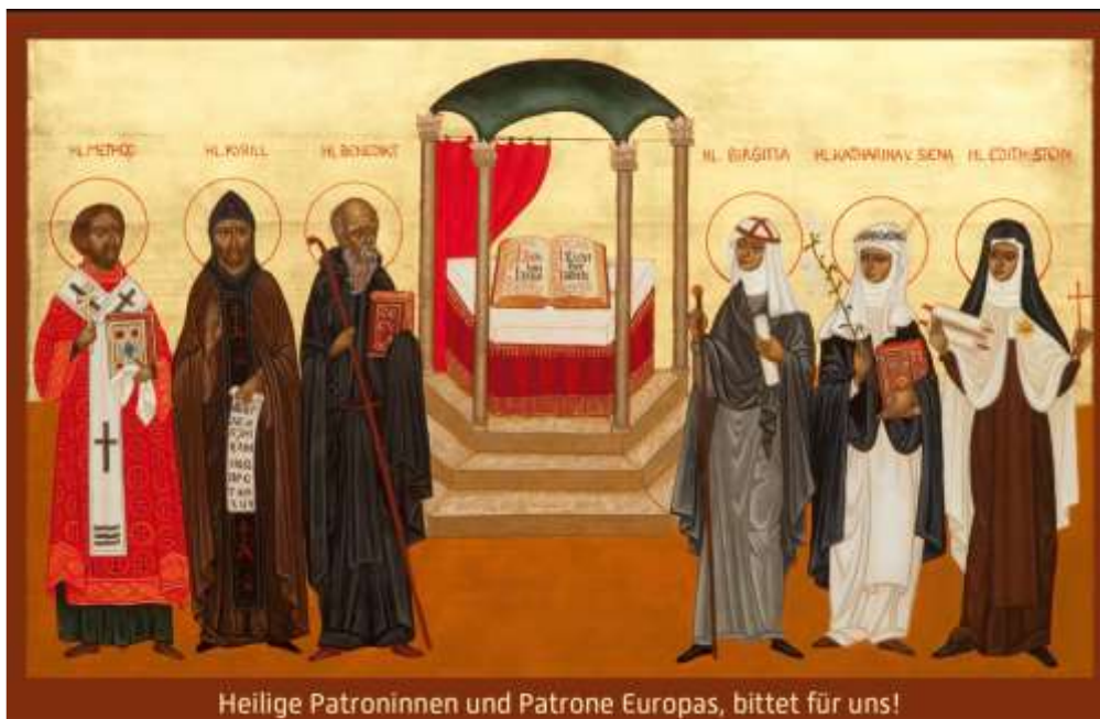
Heilige Patroninnen und Patrone Europas, bittet für uns!